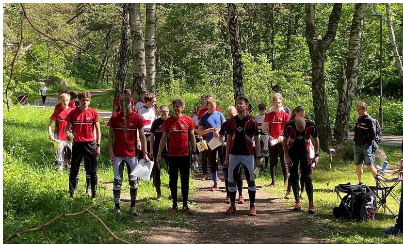
Startuppställning "I väntan på Jukola"

I härligt försommarväder i juni arrangerade GMOK träningstafetten "I väntan på Jukola" där 28 stycken SAIKare, från junior till D/H55, deltog i SAIK-lagen. Alla 4 SAIK-lag samt de 7 sträckorna startade samtidigt. Med 4 sträcksegrar och två sträck-2:or tog SAIK 1 en övertygande seger i stafetten! SAIK lag 4 var också i bra form och knep 3:e-platsen!