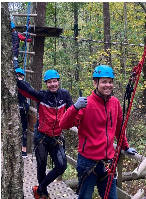
Glädje eller skräck...?