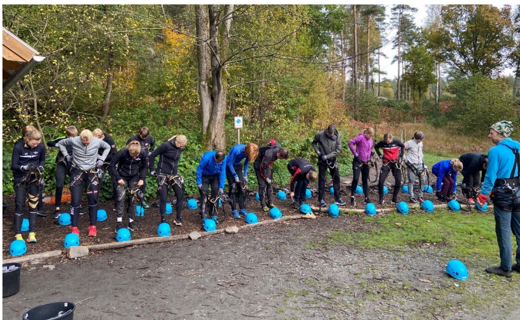
Uppställning med genomgång av utrustning.

De flesta vågade testa en eller flera höghöjdsbanor av olika svårighetsgrad med mycket glada miner efteråt. För de som hellre höll sig på backen fanns en sprint-OL i Jonsered och en mini-knat i ekbacken bredvid. Dagens avrundades med en gemensam grill-lunch.